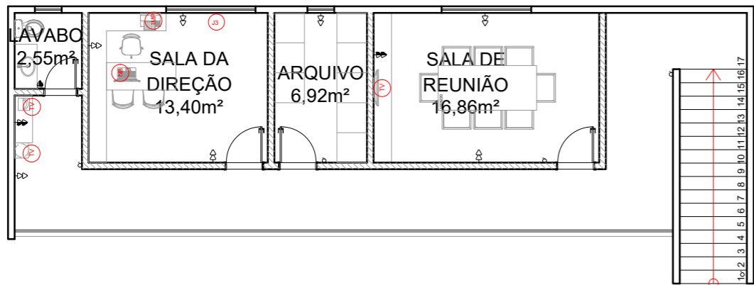
2 PLANTA DE LAYOUT - MEZANINO 1:120